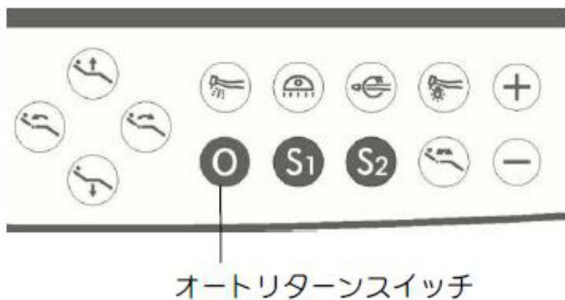
オートリターンスイッチ