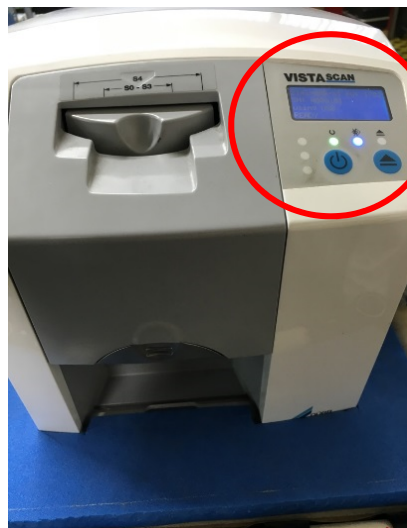
通常時(LED点灯及び液晶が表示)