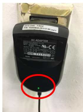
電源アダプター(LEDが点灯しているか確認)